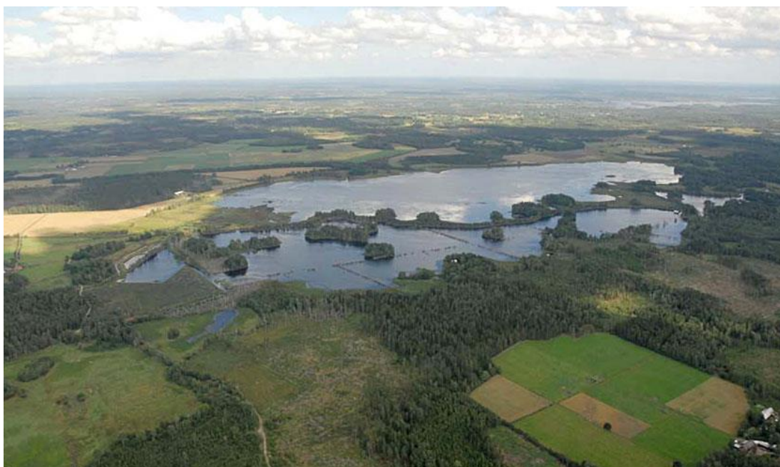
Lidhemssjön sedd från nordväst

Aggån avvattnar Lidhemssjön till Åsnen. Längs ån finns vidsträckta våtmarker som det kan vara en god idé att spana. En kulle mitt emot den gamla kyrkan i Jät är en bra observationsplats. Passa dessutom på att besöka kyrkan, den är också mycket sevärd!