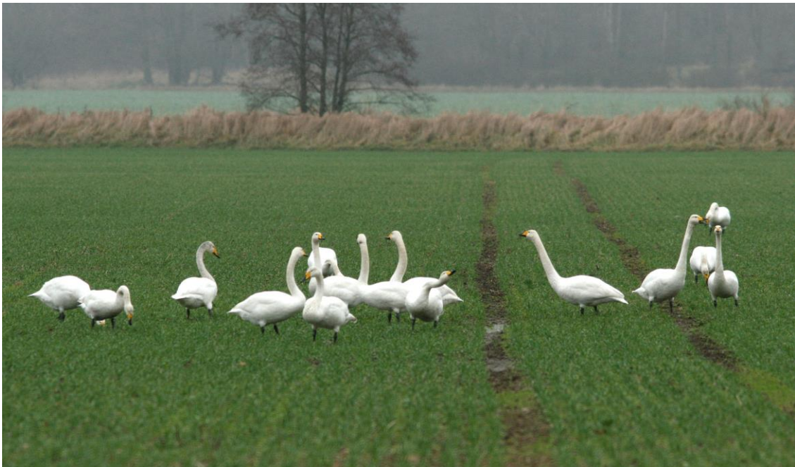
Sångsvanar på fälten öster om Jätsberg

Man kan också gå ner genom betesmarken fram till Jätsbergsviken som är en del av Jätfjorden. Här finns storlom, fiskgjuse och andra karaktärsarter för Åsnen från april t o m augusti.