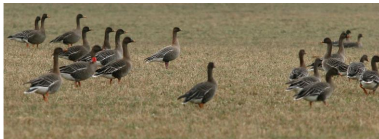
Sädgäss och en spetsbergsgås

Området kan bäst studeras från grusvägen söderut från Skye ner till gamla järnvägen, en sträcka på ca 3 km. Kartan visar några bra observationsplatser längs vägen. Vägen mellan Kullarna och den gamla järnvägen är avstängd för trafik. Den gamla järnvägen är också stängd för biltrafik.