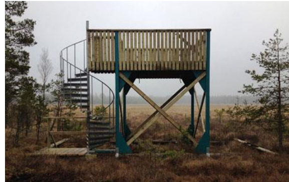
Fågeltornet vid Vannsjön