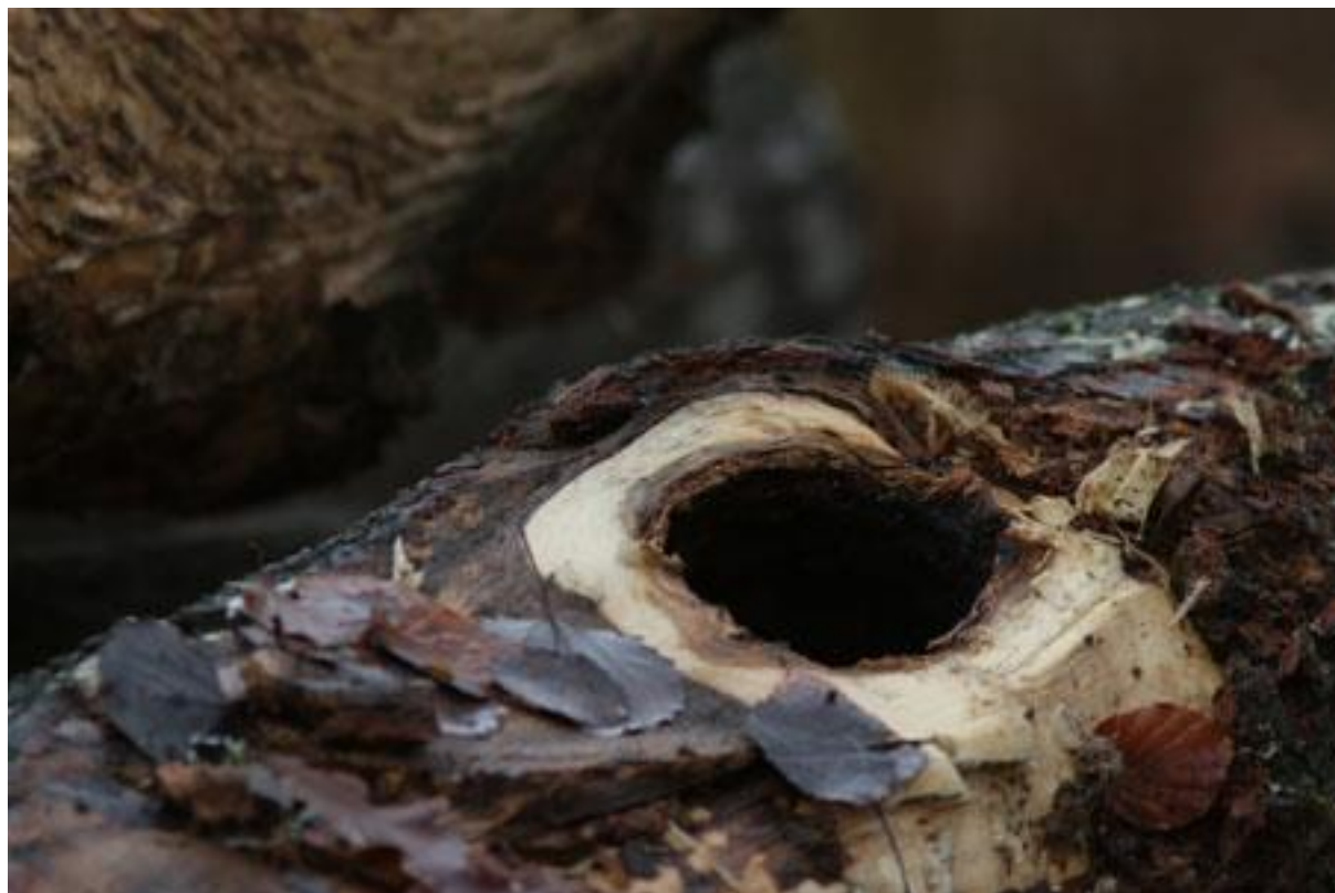
Spillkråkestam i virkeshög, Rössmåla november 2016.

Som sagt, det är spännande med ovanliga fågelarter men man kan skåda utan att vara på jakt efter sådana. I Finland försöker man få allmänheten att bygga och sätta upp en miljon fågelholkar. Hur många klarar vi av i Växjö kommun? Ugglor, knipor, storskrakar och många tättingar saknar bostäder p g a skogsbrukets ointresse för att spara lämpliga boträd för hackspettar. Bilden visar hur det kan se ut i virkeshögarna.